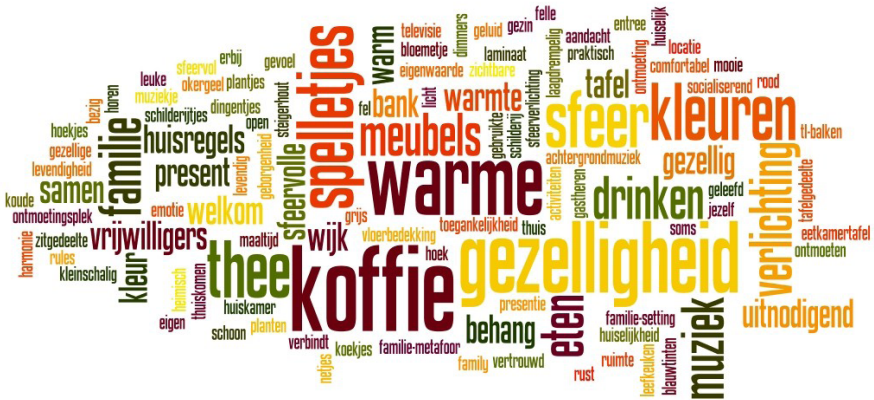
Figuur 3. Wordcloud over het huiskamermodel van House of Hope

Gevraagd naar de gewenste fysieke vormgeving van een huiskamer, wordt opgemerkt dat de sfeer in eerste instantie wordt bepaald door de mensen. Het feit dat een (groot) deel van het interieur bestaat uit tweedehands spullen is dan ook geen onoverkomelijk probleem. Voor het scheppen van een huiselijke sfeer is de inrichting echter wel ondersteunend. Centraal staat dat de inrichting de ontmoeting van mensen moet bevorderen.